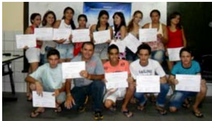
Alunos do Projeto Teia Digital no Distrito Rafael Arruda

O Projeto Teia Digital tem por objetivo promover a inclusão digital de jovens e adultos através de ações que preparam os jovens para o mercado de trabalho e estimulam iniciativas empreendedoras.