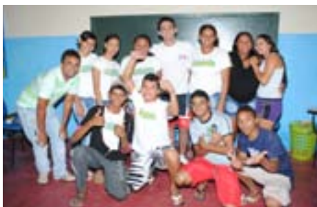
PROTEJO atende a jovens de 14 a 24 anos

O PROTEJO oferece formações sobre saúde física, grafite, música, dança, drogas, educação ambiental e sustentabilidade, além de palestras e visitas de campo. Os jovens participantes recebem uma bolsa mensal de R$ 100,00. Segundo a Subinspetora da Guarda Municipal e gestora Local do