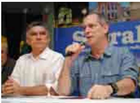
Com o Prefeito Veveu , Ciro Gomes falou para uma platéia atenta no Centro de Convenções.

da Saúde, Odorico Monteiro , falará sobre Saúde, também no Centro de Convenções. Para falar sobre Educação, estará em Sobral, no dia 25 de junho, o especialista em Educação e colunista da Revista Veja , Gustavo Iocheppe .