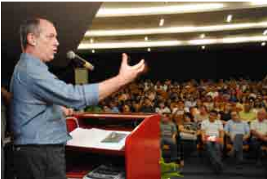
Ciro Gomes foi o 1º convidado do Ciclo de Palestras promovido pela Prefeitura

O ex-ministro Ciro Gomes proferiu nesta terça-feira, 5 de junho, palestra no Centro de Convenções de Sobral com o tema "Conjuntura Política Econômica Brasileira e Desenvolvimento", em evento aberto ao público.