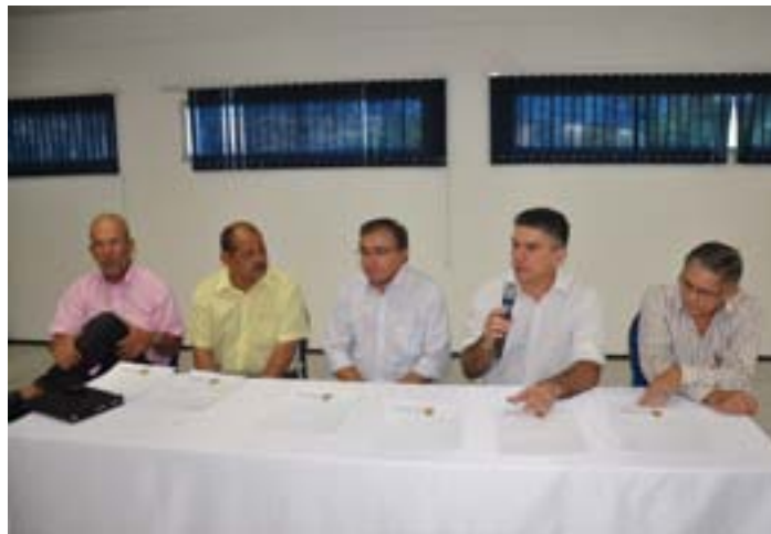
Prefeitos de 4 municípios estiveram na reunião.

A criação do aterro faz parte de um programa do Governo do Estado, em parceria com o Banco Interamericano de Desenvolvimento (BID), que financia a criação de aterros sanitários regionais no Ceará. O Aterro