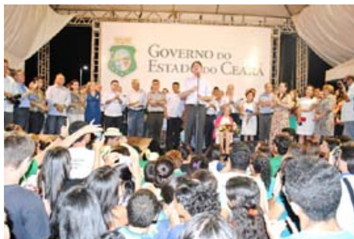
O Governador falou a centenas de pessoas presentes à inauguração da EEEP.