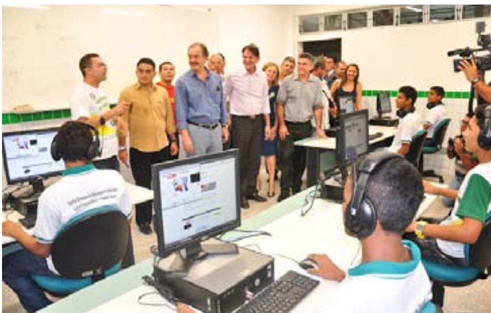
O Governador Cid Gomes visitou as instalações da EEEP, juntamente com o Ministro Mercadante e o Prefeito Veveu.

O Prefeito Veveu ressaltou o esforço que o Governador Cid tem feito para ampliar a oferta de formação profissional. "Em 2007, quando Cid assumiu, o Estado não contava com nenhuma matrícula nessa modalidade. Hoje, são 30 mil matrículas em todo o Ceará