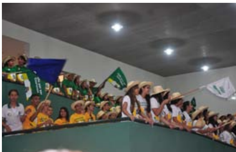
Os estudantes recepcionaram o Governador no interior da Escola.

feito aqui", disse. Ele destacou também o desempenho de Sobral nas avaliações estaduais, onde uma em cada cinco escolas premiadas no Ceará é de Sobral. "Sobral é uma referência muito importante. Tem um dos melhores IDEB [Índice de Desenvolvimento da Educação Básica] do Brasil, 6,6%", acrescentou.