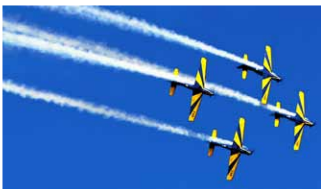
A Esquadrilha da Fumaça fará apresentação no dia 16 de novembro, em Sobral

A Prefeitura de Sobral fará hoje, 06 de novembro, a partir das 15h, no Centro de Convenções, a 6ª reunião do Gabinete de Gestão Integrada do Município (GGIM). Durante o encontro serão planejados os esquemas de segurança para o Carnabal 2012, que acontecerá nos dias 15, 16 e 17 de novembro, a apresentação da Esquadrilha da Fumaça, no dia 16 de novembro, e a festa do Natal Premiada CDL, no dia 25 de novembro.