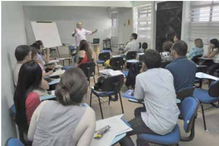
Servidores participam de curso promovido pela Prefeitura

No período de 05 a 07 de novembro, 30 servidores de diversas secretarias da Prefeitura de Sobral estarão participando do curso de formação sobre instrumentos para a boa gestão dos recursos públicos. Intitulado Processo Integrado da Execução Orçamentária e Financeira , o curso tem carga horária de 24h/aula e está sendo realizado no auditório do SAAE, no horário de 8h às 18h, com