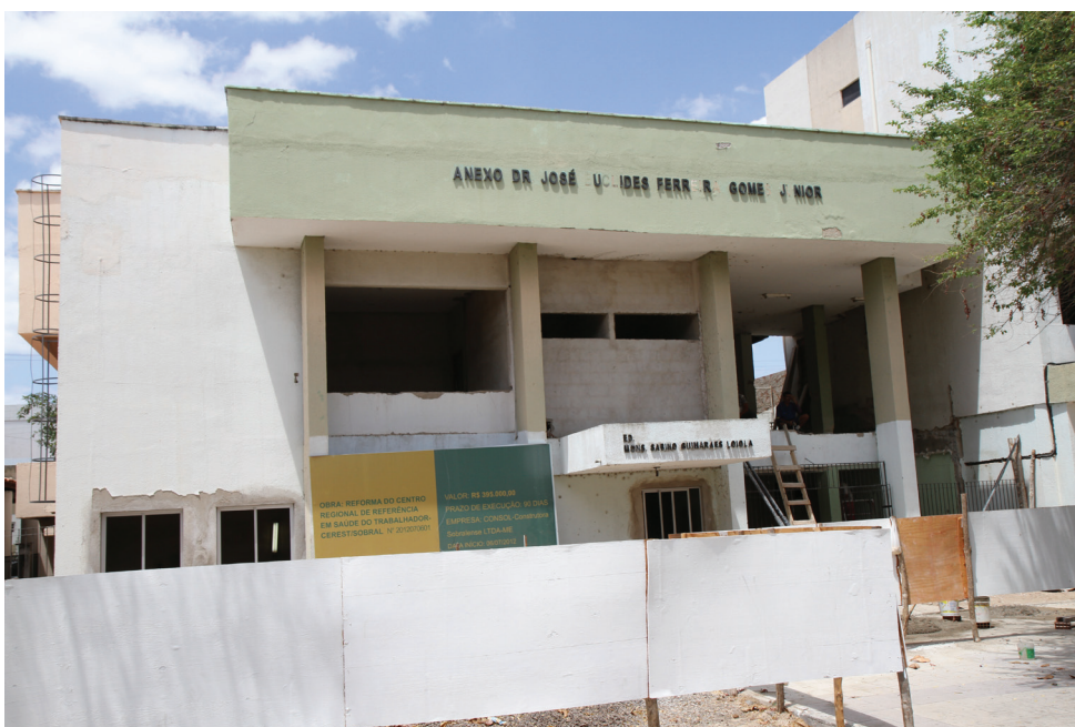
Nova sede do CEREST será no antigo Fórum de Sobral, no centro da cidade.

O CEREST, que atualmente funciona em uma sede alugada, atende trabalhadores de