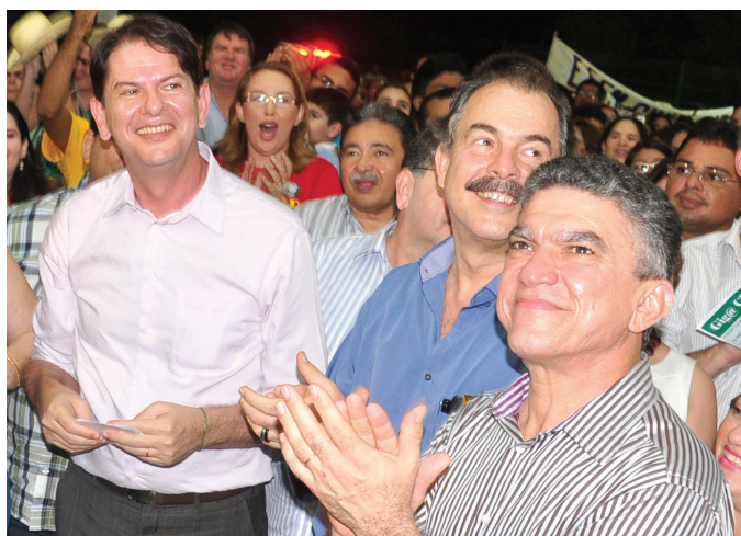
Governador Cid, Ministro Mercadante e Prefeito Veveu, durante inauguração da Escola de Educação Profissional, em maio de 2012, em Sobral.

O Pacto estabelece um conjunto de políticas públicas na área da Educação para garantir que todas as crianças do país estejam alfabetizadas até os 8 anos de idade.