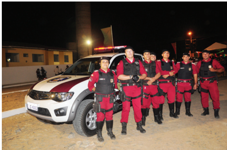
Equipe de apoio a eventos da Guarda Municipal de Sobral

As solicitações de apoio à eventos públicos podem ser feitas à Secretaria da Cidadania e Segurança. O Grupo já atuou nos Festejos do Distrito de Patriarca; em Aracatiaçu; na solenidade de entrega das casas do Programa Minha Casa, Minha Vida e Estádio do Junco, na partida Guarany x Fortaleza.