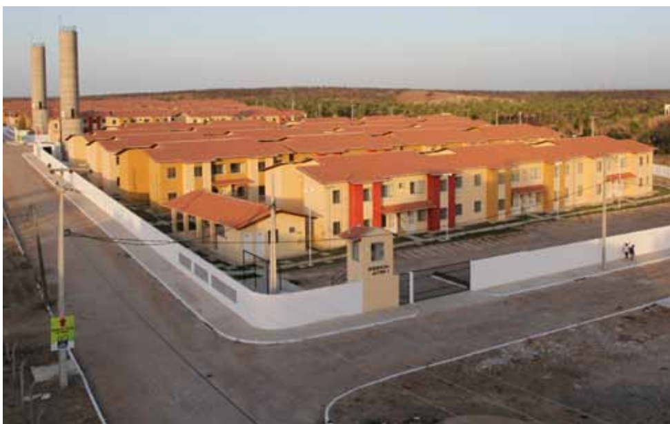
Conjuntos Jatobá I e II serão entregues aos moradores na terça-feira, 30 de outubro.

As casas são as primeiras unidades habitacionais do Programa Minha Casa, Minha Vida concluídas em Sobral. A Prefeitura já assinou, em 5 de setembro, contrato com a Caixa Econômica e garantiu o terreno para a construção de mais 2.084 casas pelo Programa, no bairro Cidade José Euclides. Saiba mais: (88) 3677-1242.