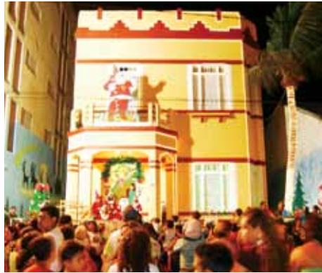
Casa do Papai Noel