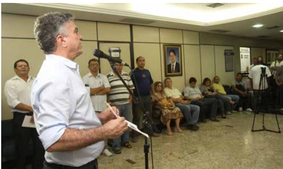
Coletiva reuniu a Imprensa sobralense no hall do 5º andar do Paço Municipal