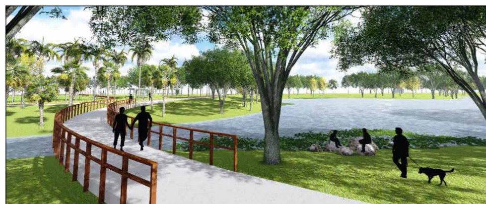
Parque Coração de Jesus, novo espaço que terá quadra de esportes, área de lazer e caminhada, vegetação e requalificação do Riacho Pajeú, interligando o Parque da Cidade à Lagoa da Fazenda.