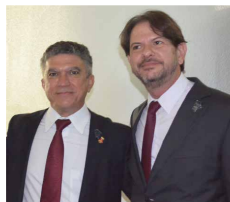
Prefeito Veveu e Governador Cid Gomes, parceria que tem mudado a realidade de Sobral

curso para a construção do Parque Coração de Jesus, que terá quadra de esportes, área de lazer e caminhada, vegetação e requalificação do riacho. De acordo com a Secretária de Urbanismo, Patrimônio e Meio Ambiente, Gizella Gomes, o projeto de construção do Parque Coração de Jesus é muito importante porque "dá continuidade à urbanização do Riacho Pajeú, iniciado com o Parque da Cidade, criando uma nova área de lazer e preservando esse recurso natural tanto do ponto de vista da infraestrutura quanto da qualidade ambiental". Também será construída a Fazendinha, espaço próximo ao Parque de Exposições na CE 362, que terá um engenho, casa de farinha e espaço para piquenique, proporcionando lazer e diversão para os sobralenses.