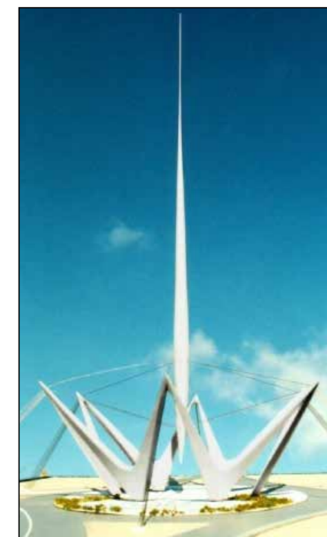
Praça do Tempo, que será um monumento na entrada da cidade, construído na rotatória em frente à Policlínica