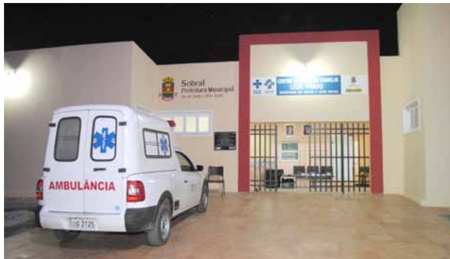
Prefeitura de Sobral garante ampla cobertura através dos Centros de Saúde da Família

Centros de Saúde da Família e 48 equipes formadas por médico, enfermeiro, técnico de enfermagem, dentista, e técnico de higiene dental. Cada equipe conta, ainda, com o trabalho dos agentes de saúde municipais que ajudam a fazer o mapeamento das áreas de atuação, com visitas regulares às famílias, criando uma aproximação maior com a comunidade para o pronto atendimento às suas necessidades.