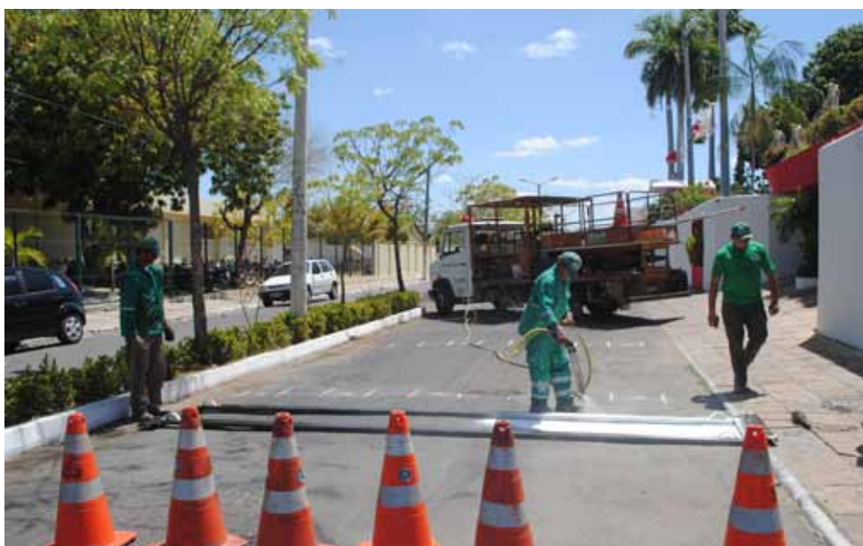
Em 2012 a Prefeitura renovou a sinalização de trânsito em diversas ruas de Sobral.

Os trabalhos de sinalização horizontal contabilizaram 14.329 m 2 . Em relação a sinalização vertical, foram colocadas 735 no-