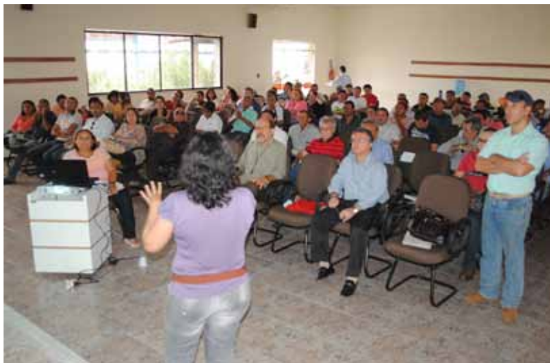
O Seminário foi realizado no Auditório Dom Walfrido