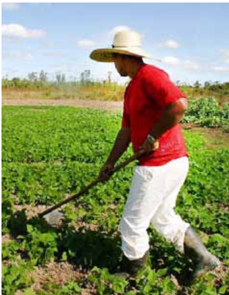
Os agricultores podem procurar a Secretaria da Agricultura para emitir o boleto no valor de R$ 9,50.

O Garantia-Safra é um seguro pago pelo Governo Federal aos agricultores familiares em caso de perda de mais de 50% da safra. Neste ano, o Programa irá pagar R$ 760, dividido em cinco parcelas de R$ 152. O valor é superior ao que foi pago em 2012, R$ 680,00. Saiba mais: (88)3611-5835.