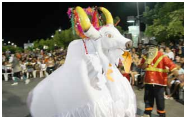
Apresentações acontecem na sede e ditritos de Sobral

A Prefeitura de Sobral promoverá, durante esta semana, apresentações do IX Encontro de Bois e Reisados nos bairros COHAB I, COHAB III, Sinhá Sabóia, Sumaré, Terrenos Novos e Centro, e nos Distritos de Aracatiaçu, Caracará, Jaibaras e Taparuaba. O encontro, coordenado pela Secretaria da Cultura e Turismo do Município, acontece até o dia 31 de janeiro e conta com a participação de 25 grupos.