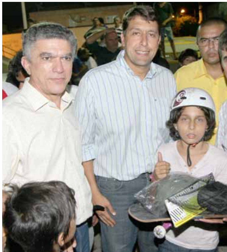
Em dezembro, Governo do Ceará doou equipamentos para o Projeto Escolinha de Skate do Município