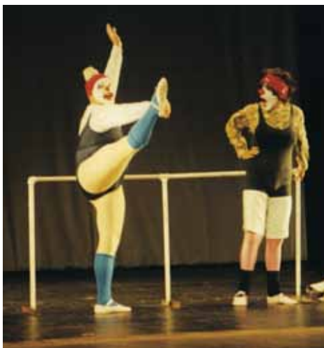
Terça de Graça apresenta o espetáculo Aula de Clownssico, no Theatro São João, às 18h30

O espetáculo, com acesso gratuito, e classificação para 12 anos, conta a dificuldade de Amálio, um indisciplinado aluno de dança, que sonha entrar no corpo de baile da academia. Mas o rapaz vai ter que se rebolar para chegar lá. Ele sofre nas mãos de uma rígida e louca professora, que o coloca em várias situações, que vão do constrangimento à dor.