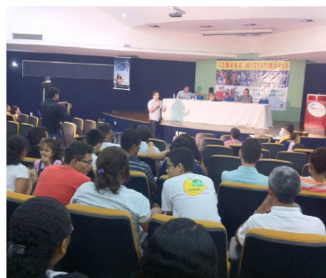
Encontro reuniu jovens, pais, professores e representantes da sociedade civil para discutir diversos assuntos relacionados à juventude

tou as ações realizadas pela gestão do Prefeito Veveu Arruda, em atenção às políticas públicas de juventude, e citou a importância dos debates para fiscalizar e motivar a criação de novas políticas.