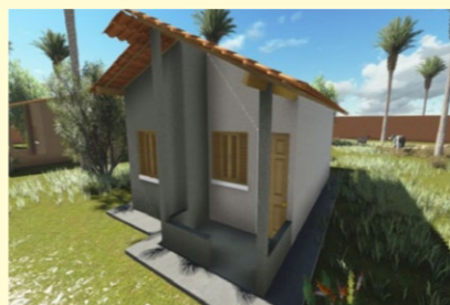
Modelo das casas que serão construídas no PNHR

O tema do programa de rádio Café com o Prefeito Veveu, desta segunda-feira, 22 de julho, foi o Programa Nacional de Habitação Rural, o PNHR, que o Prefeito Veveu lança, nesta quinta-feira, 25. O objetivo do programa, que é uma modalidade do Programa Minha Casa, Minha Vida, do Governo Federal, é oferecer moradia digna para o agricultor e eliminar as casas de taipa construindo casas de alvenaria no mesmo lugar.