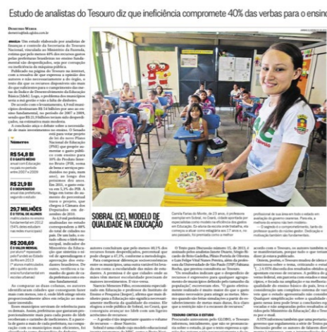
Reprodução da página do jornal O Globo

O Índice de Desenvolvimento da Educação Básica (IDEB) alcançado pela Rede Municipal de Ensino de Sobral, 7,3, ultrapassa a meta estabelecida pelo Ministério da Educação para 2021. O resultado já foi alvo de pesquisas, como a da Fundação Lemann, e matérias em várias publicações de grande circulação em todo o país, como a revista Exame, Revista Época, Jornal Gazeta do Povo (PR), Valor Econômico e outra vez Jor-