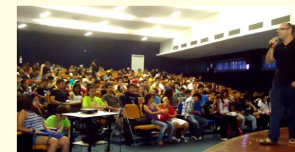
O Festival aconteceu no final de semana, no Centro de Convenções

A Prefeitura de Sobral, por meio da Secretaria da Tecnologia e Desenvolvimento Econômico (STDE), apoiou o V Festival de Anime e Mangá Sobralense (FAMS), realizado nos dias 8 e 9 de junho, no Centro de Convenções.