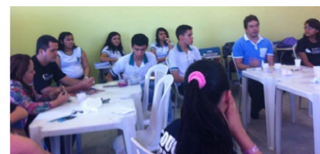
A organização iniciou suas atividades em Sobral este ano e vem beneficiando jovens através do trabalho de voluntários

A Coordenação de Juventude visitou, na terça-feira, 4, a Junior Achievement de Sobral, que forma 25 jovens alunos da Escola Estadual de Educação Profissional Dom Walfrido Teixeira Vieira. Na ocasião, foi debatido o conhecimento adquirido pelos alunos de mercado de trabalho e noções de como tornar-se empresário.