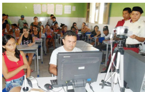
O Dia de Ação da Cidadania também já foi realizado nos distritos de Taparuaba e Jaibaras.

Secretarias da Segurança e Cidadania (SSC), da Tecnologia e Desenvolvimento Econômico (STDE), do Desenvolvimento Social e Combate à Extrema Pobreza (Seds), da Cultura e do Turismo (Secult), e do Esporte (Sesporte).