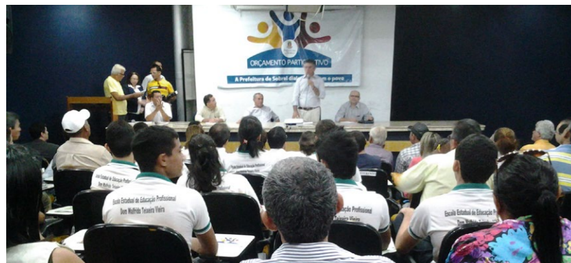
O Prefeito Veveu Arruda agradeceu a participação de todos e ressaltou a importância do engajamento da sociedade no Orçamento Participativo

A Prefeitura de Sobral realiza, nesta terça-feira, 11, plenária de lançamento do Orçamento Participativo. O evento acontece no auditório da Prefeitura de Sobral, das 9h às 11h, e conta com a participação de toda a sociedade.