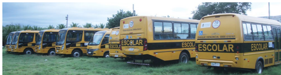
A frota vai atender aos alunos da Rede Municipal de Ensino na sede e distritos pelo Programa Caminho da Escola.

O Governo Federal, por meio do Fundo Nacional de Desenvolvimento da Educação