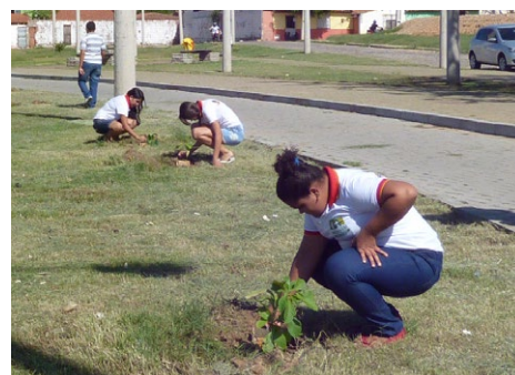
Participaram da atividade representantes de movimentos juvenis que escolheram as espécies Ipê Roxo, Branco, Pereira, Xixá, Pau-Branco e Jenipapo

O Banco de Mudas de Sobral, grande apoiador dessas atividades, foi criado em 2001 com diversas espécies de plantas me-