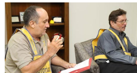
O cadastro será realizado na Coordenação de Transportes

A Secretaria de Conservação e Serviços Públicos (Seconv) realizará, entre os dias 7 e 10 de maio, o cadastramento de reserva para mototaxista substituto, quando será avaliado o perfil desses profissionais que atuam no sistema, com comprovação documental de pelo menos um ano.