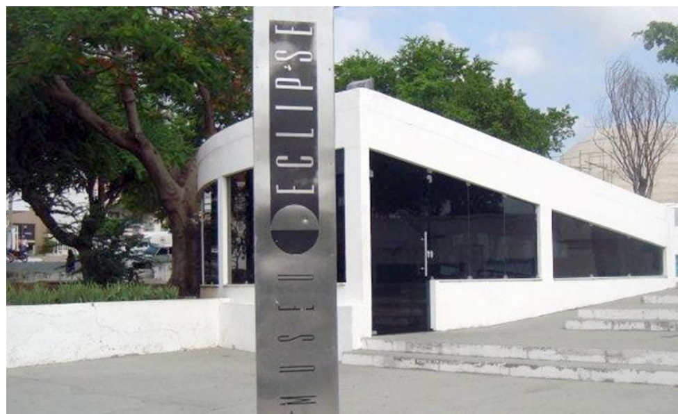
O Museu foi fundado no ano de 1999 para celebrar os 80 anos do experimento de comprovação da Teoria da Relatividade, concebida pelo Físico Albert Einstein

Nesta quarta-feira, 29 de maio, o Museu do Eclipse de Sobral completou seu 14º aniversário. O Museu foi fundado no ano de 1999 para celebrar os 80 anos do experimento de comprovação da Teoria da Relatividade Geral, concebida pelo Físico Albert Einstein.