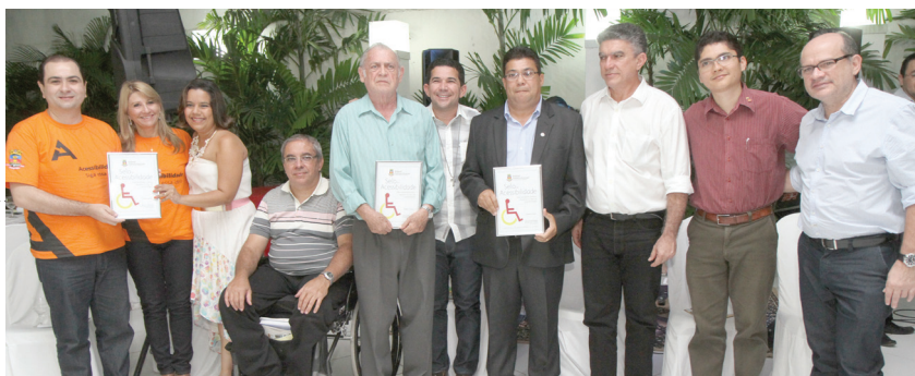
Foram premiadas 4 empresas com Selo de Acessibilidade, padrão Prata

Durante o evento o Prefeito Veveu destacou que em Sobral estamos construindo uma cidade mais inclusiva e justa. "Todos os novos prédios públicos que estão sendo construídos são acessíveis e mesmo os antigos serão adaptados". O Prefeito também garantiu apoio para ao projeto Censo Inclusão Sobral, um levantamento de onde e como vivem as pessoas com deficiência de