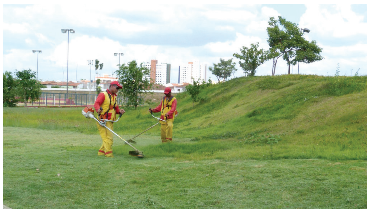
Serviços de limpeza foram executados na Margem Esquerda

Nesta sexta-feira (15), às 15h, será realizada, no bairro Novo Recanto, uma Gincana Cooperativa em defesa do meio ambiente. Dentro das atividades, voltada para as crianças, serão realizadas: coleta de garrafas PET, elaboração de redação sobre Meio Ambiente, apresentação teatral abordando o tema e plantio de mudas.