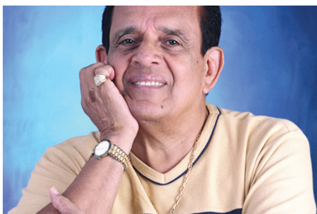
Cantor e compositor Evaldo Gouveia

Além delas, “Esquinas do Brasil”, que tem