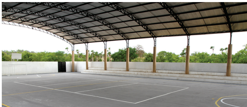
e a Quadra Poliesportiva serão inauguradas pelo Prefeito Veveu sábado (16), às 19h

O Prefeito Veveu inaugura, no sábado (16), às 19h, a nova Quadra Poliesportiva e a Estrada Moacir Lima Feijão, que liga Sobral ao Distrito do Bonfim. Nas duas obras foram investidos cerca de R$3,5 milhões.