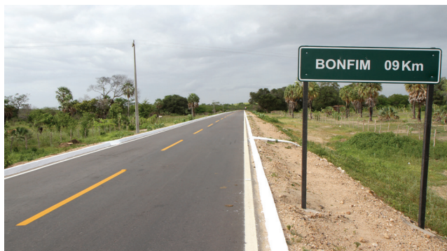
A Estrada Moacir Lima Feijão, no Distrito de Bonfim,