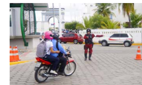
Tráfego na rotatória do Boulevard do Arco é orientado por guardas municipais

A Secretaria também tem mapeado outras áreas críticas e prepara um esquema de segurança viária que beneficie motoristas e pedestres. Um estudo sobre o tráfego de veículos na Avenida Dr. Guarany/Rotatória do Arco já foi concluído e