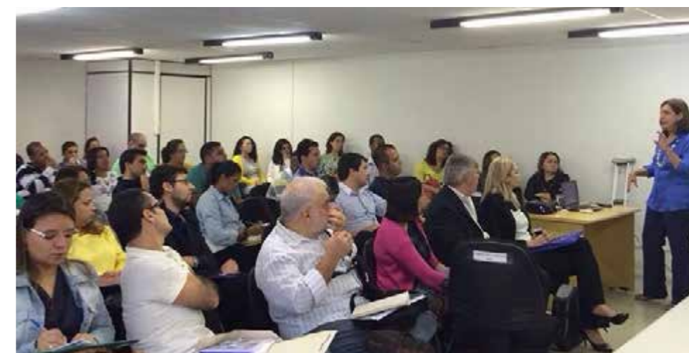
II Oficina Nacional de Capacitação das Equipes do Programa Estação Juventude reúne participantes de todo país em Brasília.

O Programa Estação Juventude visa promover a inclusão e emancipação de jovens com a ampliação do acesso às políticas públicas por meio de equipamentos públicos. A Estação da Juventude oferece