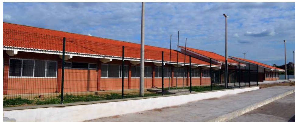
Primeiro Colégio Sobralense deverá ser inaugurado no Complexo Monsenhor Aloísio, ao lado da Policlínica

A meta é construir 17 escolas de Tempo Integral que terão capacidade para 500 alunos que vão estudar do 6º ao 9º ano e terão 12 salas de aula, administração, biblioteca, sala multimídia, laboratórios de física, química, biologia e matemática, bloco do recreio (cozinha, despensa, banheiros, vestiários, armários para os alunos guardarem seus pertences e espaços de descanso após o almoço), quadra poliesportiva e anfiteatro, onde os alunos passarão as 9 horas que estiverem na escola.