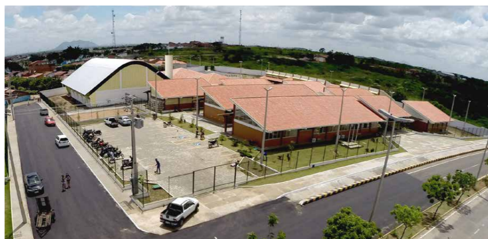
Colégio Sobralense de Tempo Integral Maria Dorilene Arruda Aragão atenderá 500 alunos do Complexo Monsenhor Aloísio