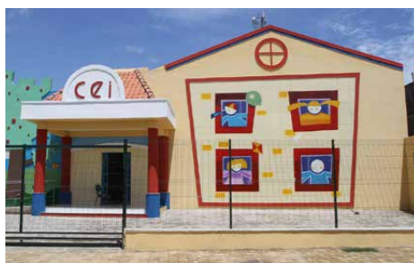
Já foram inaugurados 3 CEI, no total serão 16.

Após se tornar referência nacional em educação com excelentes indicadores dos alunos das séries iniciais do ensino fundamental (alcançando o IDEB esperado para 2021), o objetivo da iniciativa é melhorar ainda mais os resultados de aprendizagem no Segundo Ciclo do Fundamental (6º ao 9º ano), tornando o Município uma referência de práticas exitosas, com indicadores de qualidade no ensino público também para as séries finais do ensino fundamental.