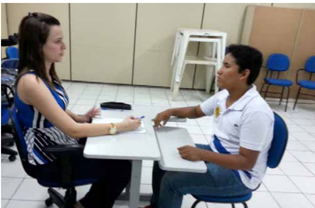
Resultado das entrevistas para Guarda Mirim será divulgado dia 07/03

A Prefeitura de Sobral, através da Secretaria da Cidadania e Segurança, está realizando a 2ª Etapa do Concurso de Guarda Mirim. Desde segunda até sexta-feira (28/02), 300 candidatos passam por entrevistas. O resultado será divulgado dia 07 de março.