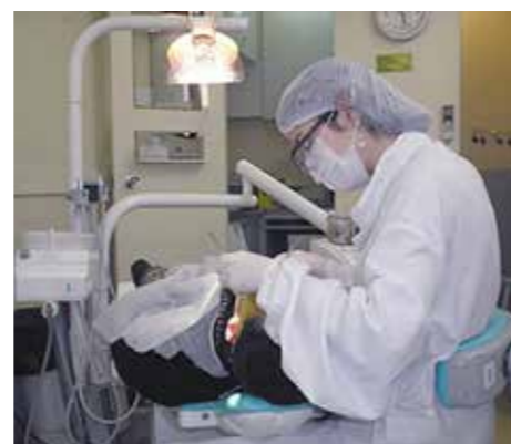
Atendimentos em urgência odontológica acontecem na Unidade Mista da Cohab I

Para o atendimento normal, realizado de segunda a sexta-feira, nos horários das 7h às 11h e 13h às 17h, os pacientes interessados deverão dirigir-se ao setor odontológico do Centro de Saúde da Família de cada bairro. Saiba mais: (88) 3614-3018.