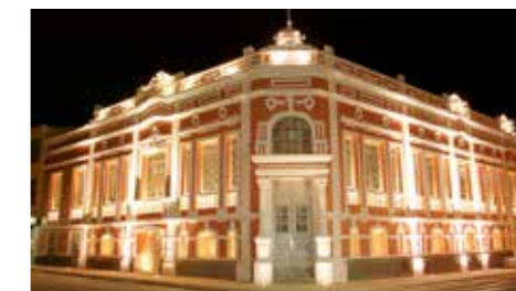
Palácio é destaque na TV Escola

Fundado há 14 anos, o Palácio de Ciências e Línguas Estrangeiras, possui atualmente 2.485 alunos, sendo 1.510 (línguas); 450 (Informática) e 525 (Ciências).