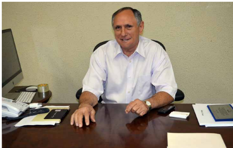
Prefeito em Exercício, Itamar Ribeiro, fará inauguração de Unidade de Saúde, na localidade de Recreio, em Rafael Arruda, nesta sexta-feira, 9 de maio.

A Unidade atenderá mais de 700 moradores com serviços de consultas médicas, enfermagem, verificação, imunização, prevenção de câncer ginecológico, pré-natal, planejamento familiar, puericultura, entrega de medicamentos, acompanhamento de hipertensos e diabéticos e procedimentos como, curativos, administração de medicação, aerossol, vacinas, aferição de pressão arterial e outros.