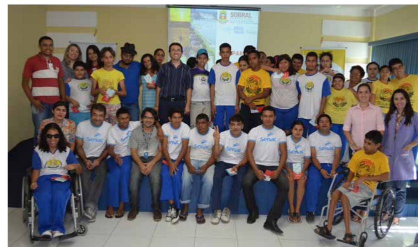
Aula inaugural aconteceu na sede da APAE de Sobral.

A Prefeitura de Sobral realizou, nesta quinta-feira, 8 de maio, aula inaugural com alunos da Associação de Pais e Amigos dos Excepcionais (APAE) de Sobral, inscritos nos cursos de serigrafia e manicure/paedicure, ofertados pelo Programa Nacional de Acesso ao Ensino Técnico e Emprego (PRONATEC), do Governo Federal.