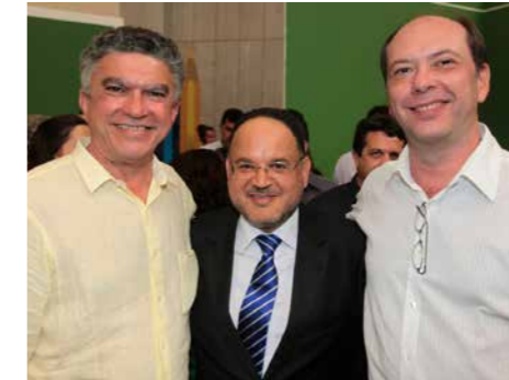
O Prefeito Veveu participou da premiação das Escolas Nota 10, juntamente com o Ministro da Educação Henrique Paim e o Secretário de Educação de Fortaleza, Ivo Gomes.

O índice de proficiência média dos alunos de Sobral no 5º, em português, foi de 255,7, superior ao ano de 2012, que foi de 240,1. Na proficiência em Matemática, a média foi de 284,1 pontos, também superando o índice do ano anterior, que foi de 265,6.