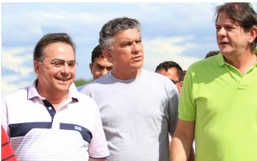
Governador Cid Gomes, Prefeito Veveu e o ex-Ministro Leônidas Cristino acompanham a comitiva da presidente Dilma, na visita à Sobral.

Pelo Projeto São José III serão autorizados também R$ 20 milhões para início das obras de 30 projetos de abastecimento d'água com esgotamento sanitário e para 14 projetos de reuso de água, que vai beneficiar mais de 3 mil famílias cearenses.