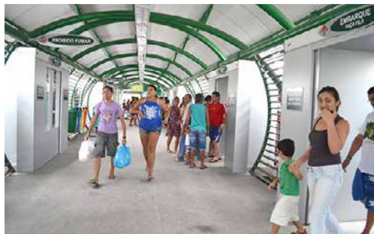
Desde o início da operação assistida, em 22 de outubro deste ano, mais de 32 mil pessoas já utilizaram o Metrô de Sobral.

Jesus, de onde os passageiros podem embarcar para qualquer das estações de uma das duas linhas.